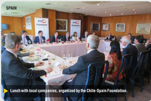
Lunch with local companies, organized by the Chile-Spain Foundation.