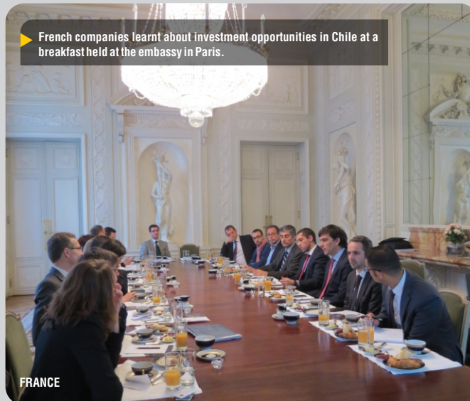
French companies learnt about investment opportunities in Chile at a breakfast held at the embassy in Paris.