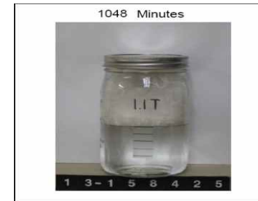
DFL Hydrophobic Shake Test