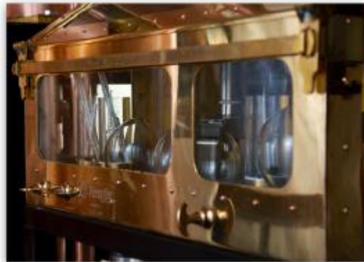
Copperworks의 Spirit Safe