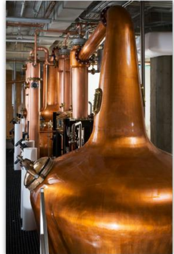
Copperworks의 Wash Still