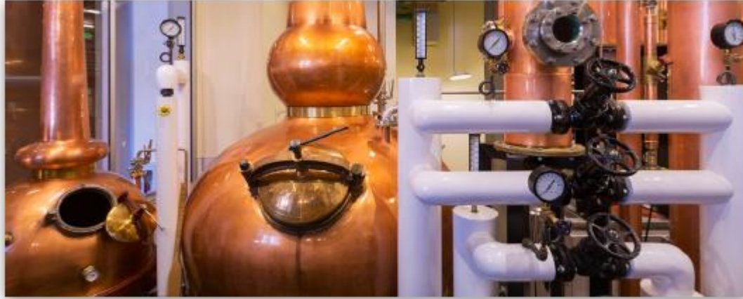
왼쪽에서 오른쪽으로: Gin 증류기, Whiskey Spirit 증류기, 25-plate Column 증류기