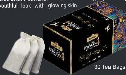
30 Tea Bags