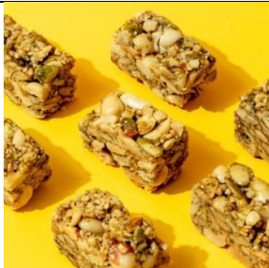
타타르메밀 스낵 - 6종의 견과류를 함유(땅콩, 아몬드, 건포도, 참깨, 호박씨, 호두알)하며 다른 첨가물이 없는 건강한 간식입니다.