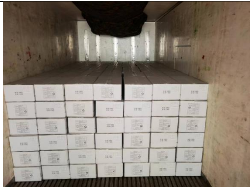
가공현장 / 배송현장