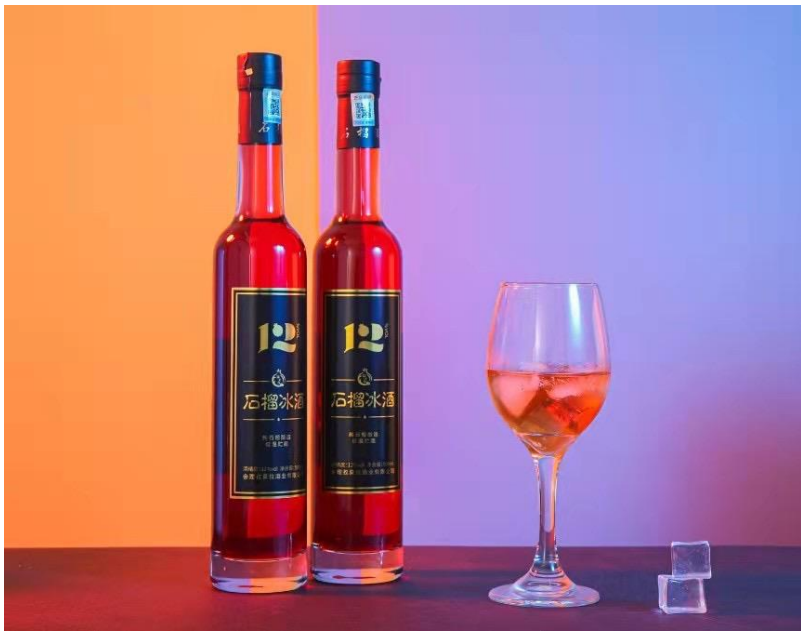
석류 아이스 와인 - 매 500ml당 5kg의 석류가 함유됨