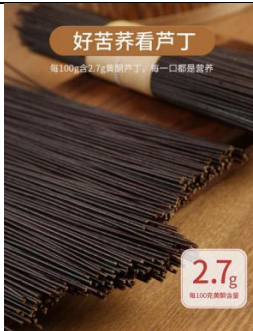
타타르메밀 면, 100% 흑타타르메밀 가루로 다른 첨가제가 들어가지 않습니다. 매 100g당 플라보노이드 함량 2.7g.