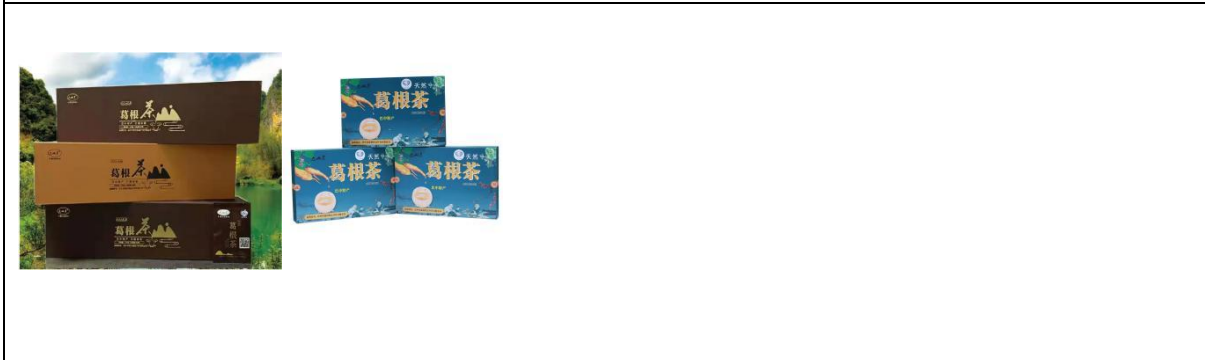
찻차 - 침뿌리를 갈아서 티백으로 만든 차