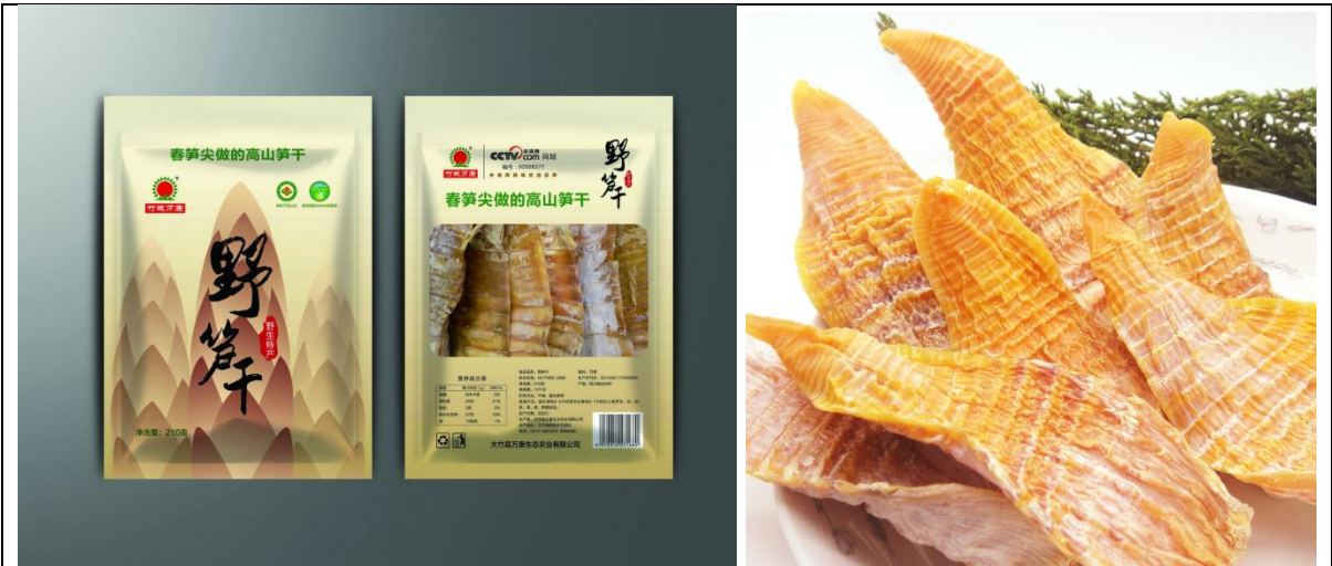
야생 건조 죽순 240g 유기농 식품인증