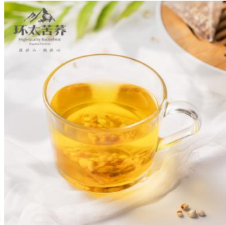
홍두, 울무, 감실, 타타르메밀차 - 홍두와 울무, 감실, 타타르메밀, 보리, 붉은 팥, 굴껍질, 치자를 함유하여 정밀하게 배합한 차로 부기를 제거하고 추위를 쫓으며, 피부미용에 좋은 효과가 있습니다.