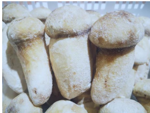
건조송이 / 냉동송이