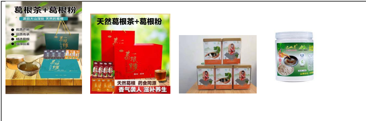
침뿌리 - 개별포장된 찻가루와 찻차 / 찻가루 - 가정용 패키지