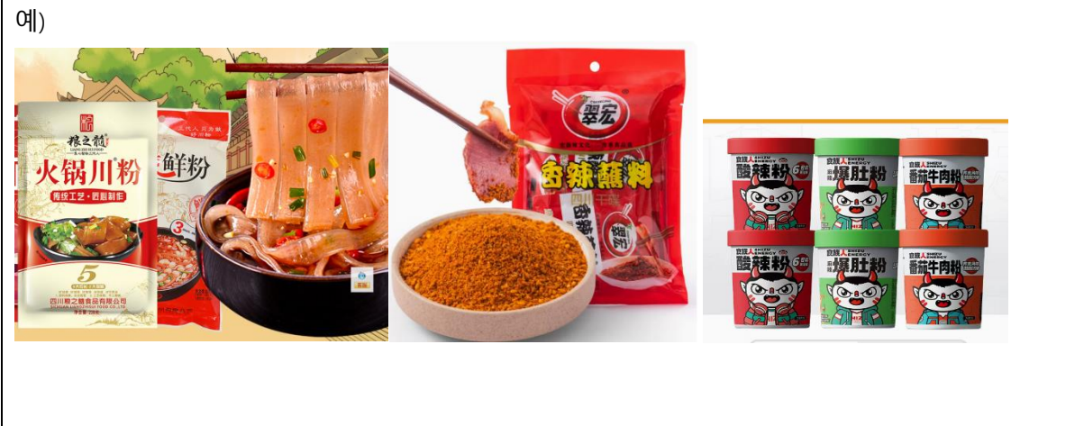
훤귀당면(마트포장&업소용포장) / 짝어먹는 매운소스 / 인스턴트 수안라편(여러가지 맛)