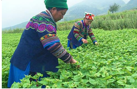
고지대 흑타타르메밀차 - 매100g당 루틴함량 1.3g. / 풍족한 환경의 녹색 차밭