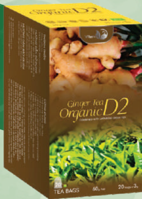
Ginger and Licorice Tea