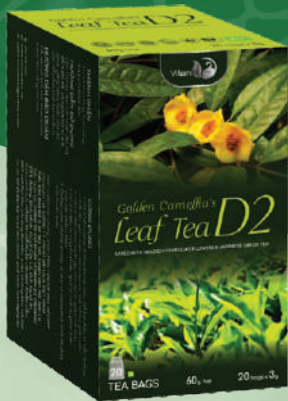
Golden Camellia Tea