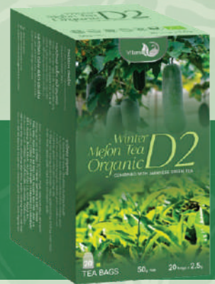
Winter Melon Tea