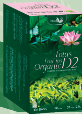
Lotus's Leaf Tea/ Embryo Tea