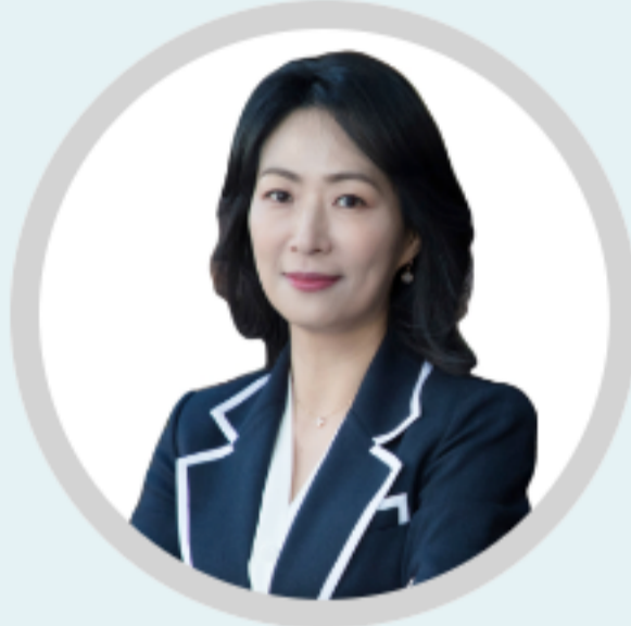
황지영 교수 노스캐롤라이나대학 리테일매거진 칼럼니스트 (2007~)