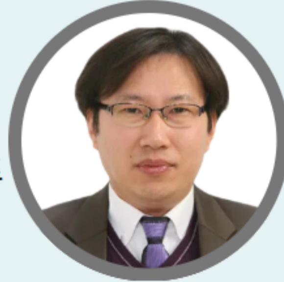
김창주 교수 일본 리츠메이칸대학교 경영대학 부학장